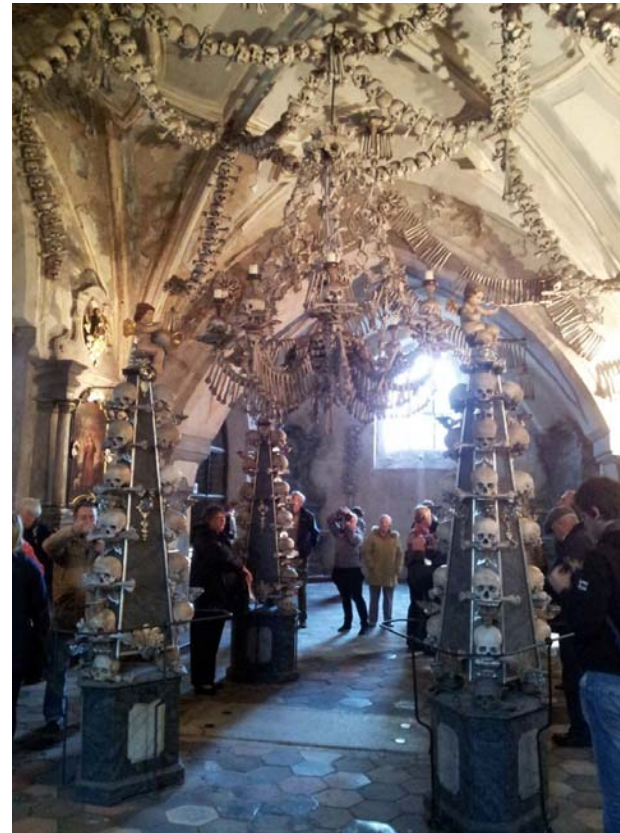
Kutna Hora & Sedlec Ossuary (1511 A.D.)