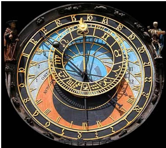
Astronomiska uret (1410 A.D.)