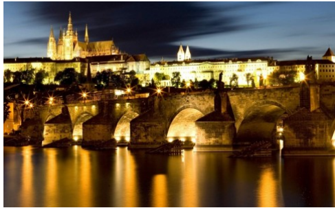
Prazsky Hrad & Karlsbron (870 & 1357 A.D.)