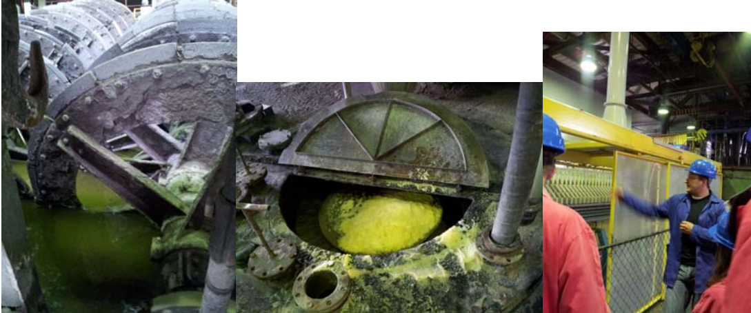
Bilder från yellow cake-anläggningen, från vänster till höger: Kvarnar för malning av uranmalm (steg 1 ovan), Jonbytarmassa för separering av uran från laktlösningen (steg 4 ovan), Filtrering (steg 8 ovan)

Anläggningen producerar 2 020 ton yellow cake per år. Yellow cake från Rozna skickas till Ryssland för anrikning och bränsletillverkning. Bränslet används sedan i de tjeckiska kärnkraftverken (av rysk design, s.k. VVER).