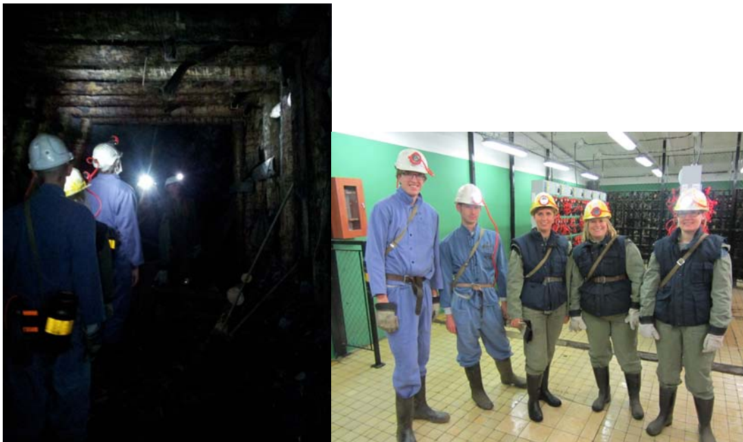
Bilder från Rozna urangruva, från vänster till höger: Inne i gruvgången, YG18 Miljögruppen (delar av den) klädda för ett besök i underjorden

Alla brytningsplatser är knutna till ventilationsschakt som sörjer för tillförsel av frisk luft och bortförsel av hälsofarliga gaser t.ex. radon. I gruvan finns också ett antal pumpar för att pumpa bort vatten. Det finns cirka 1 mg uran/liter vatten, därför renas vattnet. Efter rening finns cirka 0,001 % uran kvar i vattnet. Det finns 11 pumpstationer och årligen pumpas och renas 1 500 000 m 3 vatten.