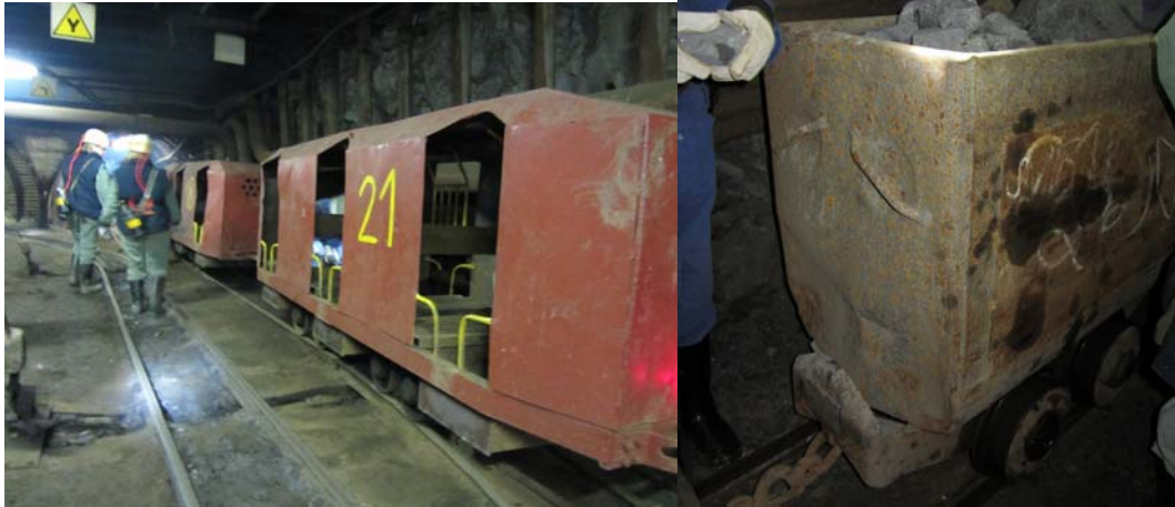
Bilder från Rozna urangruva, från vänster till höger: Gruvtåget, Uranmalm