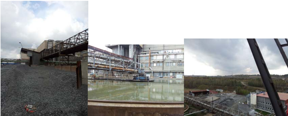
Bilder från yellow cake-anläggningen, från vänster till höger: Uranmalm från gruvan, Sedimentering (steg 2 ovan), Utsikt över tailing ponds

I anslutning till yellow cake-anläggningen finns stora "tailing ponds" där slammet hamnar. Dammarna har ett dränagesystem för att hindra utläckage av smutsigt vatten. Slamhögarna är det främsta restavfallet från processen. I nuläget är högarna cirka 50 meter höga men de ökar ständigt, och har ackumulerats under anläggningens hela livstid.