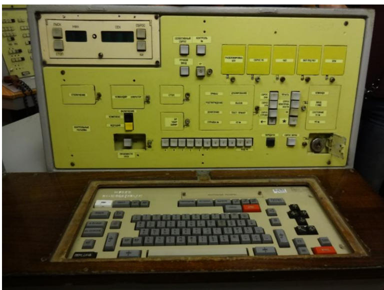
Kontrollpanel för avfyrning av missiler