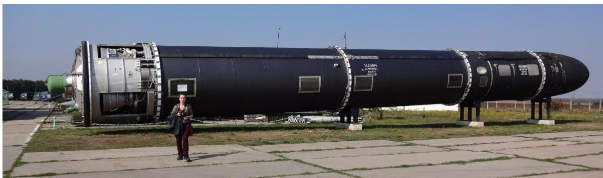
Petty och den 33 m långa missilen Satan

Ett par kärnvapenofficerare, som jobbade på basen under kalla kriget, och en engelsktalande guide visade oss anläggningen. Utomhus fanns mängder av missiler uppradade, bl.a. långdistansmissilen Satan som kunde laddas med kärnvapen. Vi fick även titta på avfyrningssilos och provsitta de maskiner som en gång tankat missiler med raketbränsle.