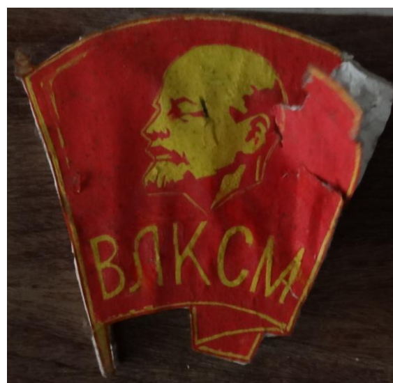
Propagandaaffischer fanns överallt.

T.v. "Det finns ingen som står högre i rang än den arbetande mannen."