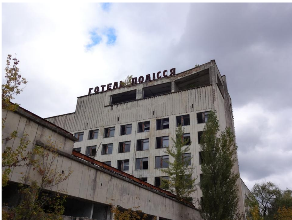
Prip'yats glassiga hotell, med utsikt över staden och Tjernobylreaktorerna en bit bort.